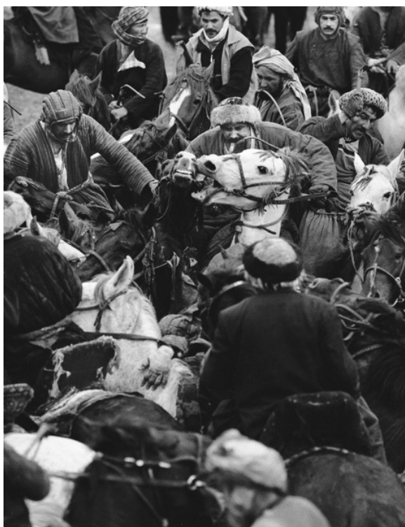
Mars 2005. Grand Bouzkachi (environ 200 chevaux) à Mazar e Sharif

Du 31 mai au 20 juin 2022 au Musée de la Chartreuse de Douai